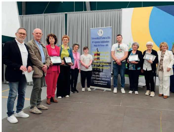
Premiazione della 14ª Mostra di Pittura a Lignano Sabbiadoro.

Chiusura dell'Anno Accademico 2024-25 Auditorium - Centro Culturale Aldo Moro da definire