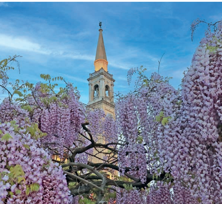
Due simboli di Cordenons.