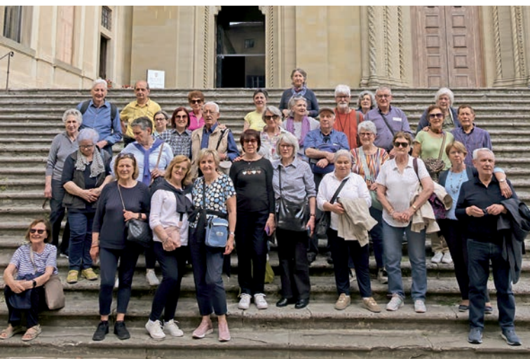
Visita guidata ad Arezzo - maggio 2024.