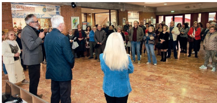
Inaugurazione Mostra delle opere dei corsisti.

I corsi saranno attivati con minimo 12 persone.