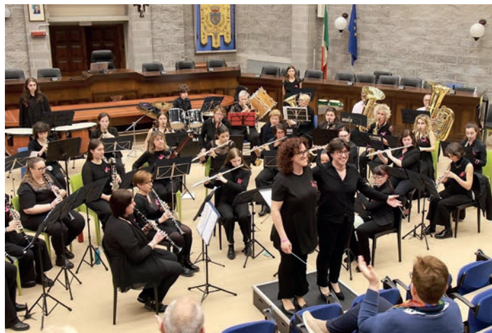
Chiusura dell'Anno Accademico 2023-24. Concerto della Banda in Rosa.