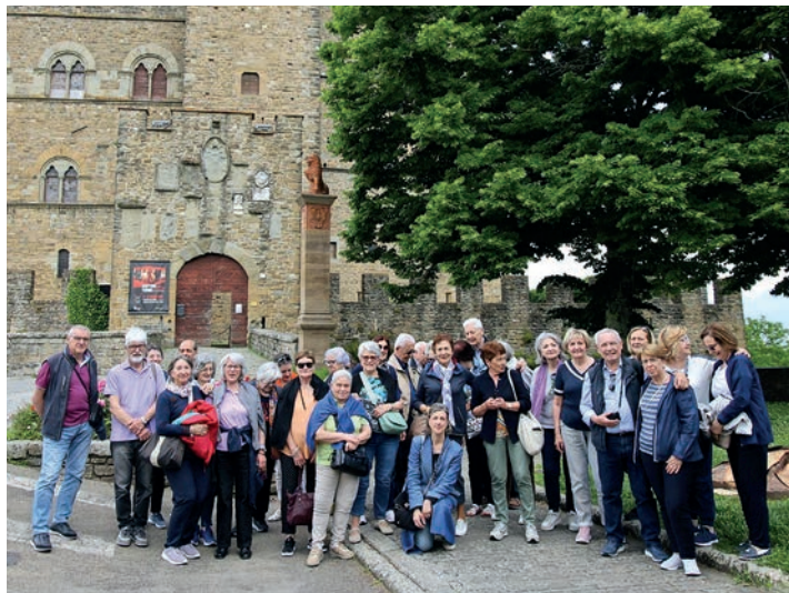
Visita guidata a Poppi - Arezzo.

Saranno organizzate visite guidate sul territorio ed in altre località rilevanti da un punto di vista artistico-culturale. Date e programmi dettagliati saranno comunicati di volta in volta e con adeguato anticipo. Le visite della durata di un solo giorno potranno essere replicate se sarà raggiunto un numero di partecipanti adeguato.